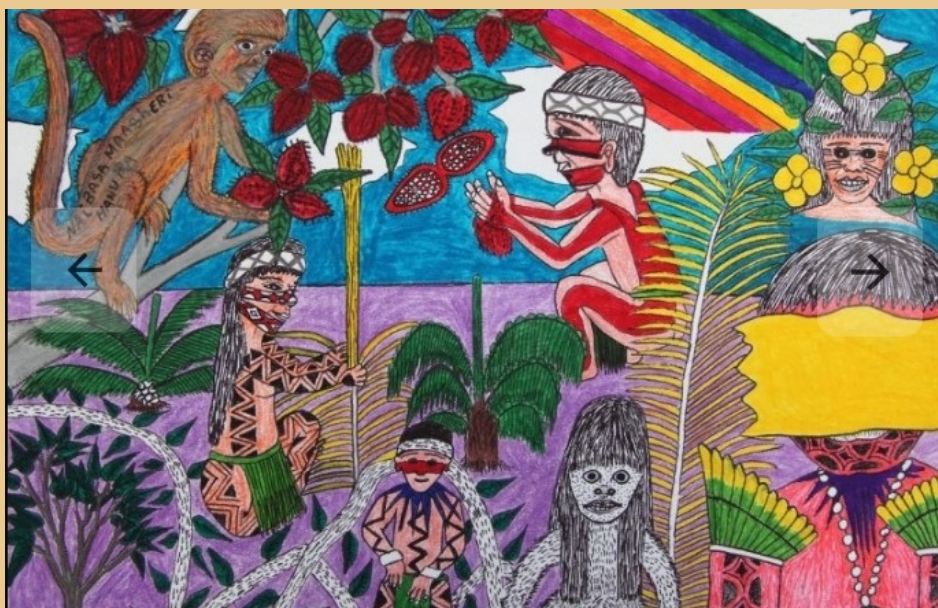
"Nai Basa Masherri" Pintura com giz e caneta (2014)

Ibã é um txana, mestre do canto do seu povo, além de artista e professor.