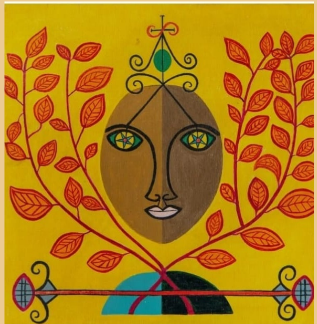
"Celebração à Légba"